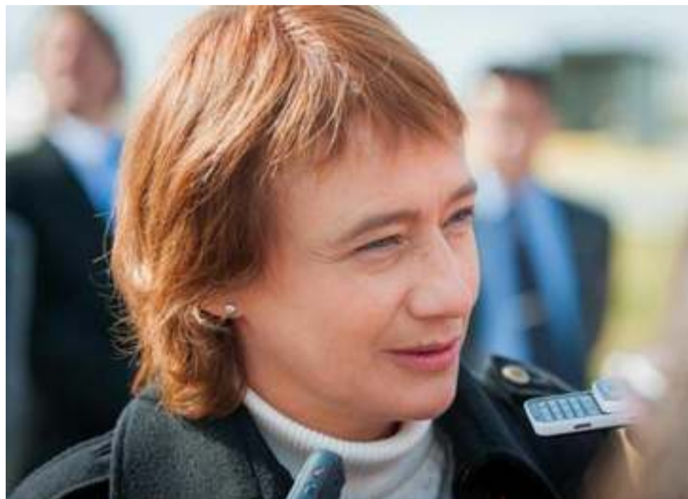
“A partir de la reforma de la constitución del 94, el artículo 37 obliga al estado nacional a reconocer un problema en relación al género en el ámbito público y a dictar medidas”, concluyó.

Y pidió “reconocer que hay categorías de personas que por cuestiones culturales sociológicas y estructurales tienen una subrepresentación. Hasta hace 70 años las mujeres éramos consideradas por el Código Civil como incapaces, esto construye cultura, mientras que los hombres venían de más de un siglo sosteniendo su decisión en el espacio público”.