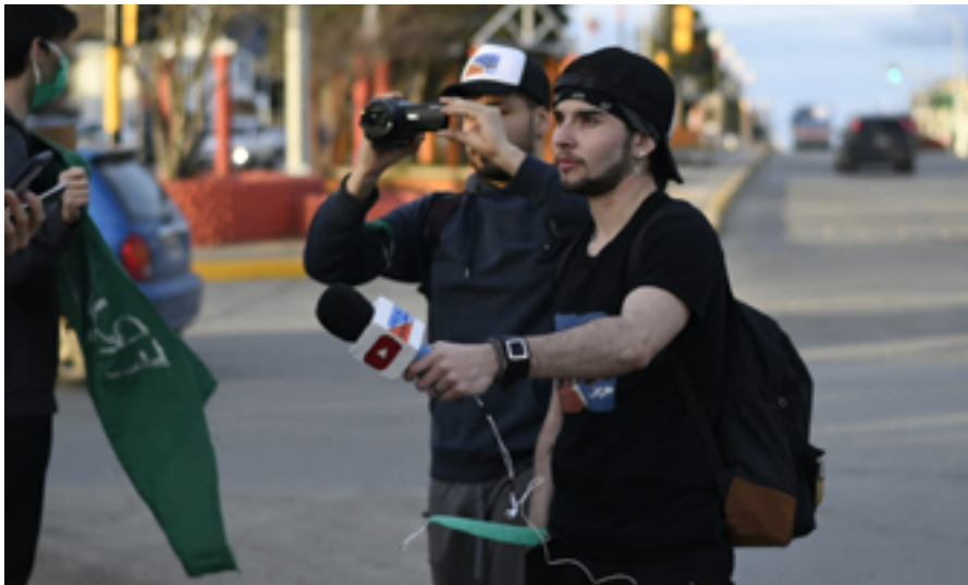
Made in Río Grande. Una mirada virtual sobre la realidad cultural.

* Entrevista realizada por alumna de 3° año de la Tecnicatura Superior en Comunicación Social del CENT N° 35, en el marco de la materia Prácticas Profesionalizantes II.