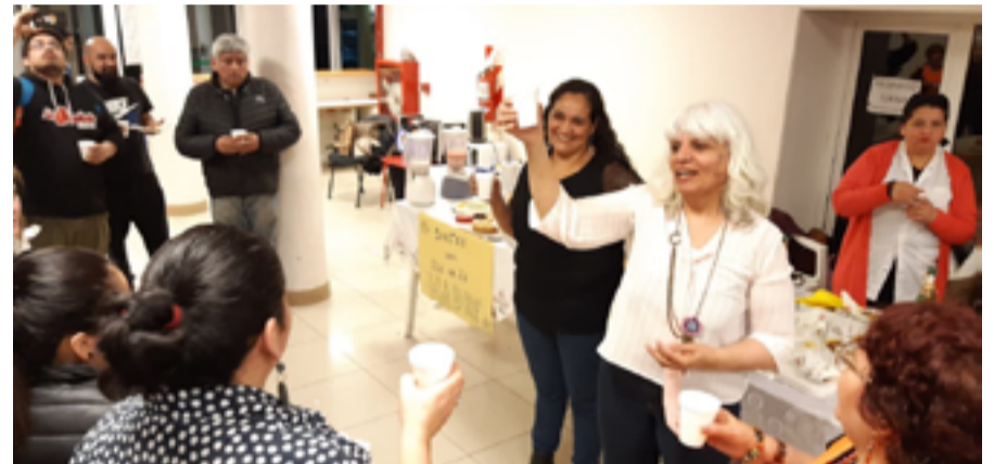
Por Fabiana Morúa.

Festearon años de sostén propio, comunitario y voluntario. Realizaron un brindis y el corte de torta el día sábado junto a todos y todas las presentes.