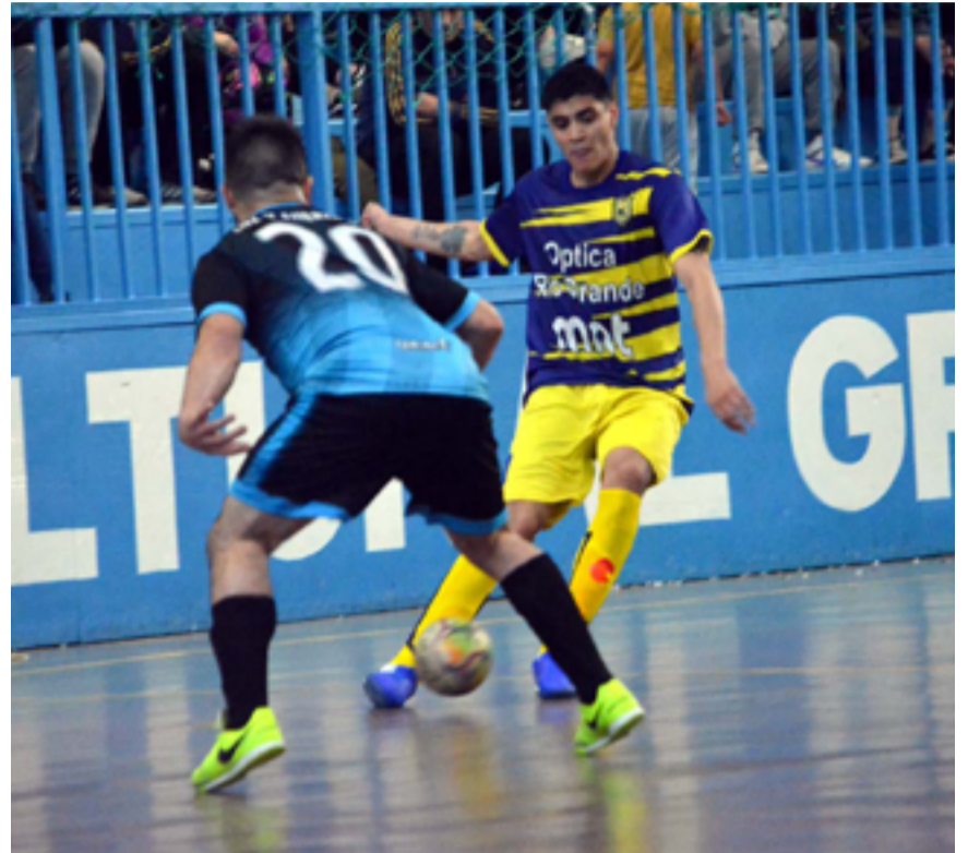
de 3, Deportivo Huinoil 3 y 9 de Octubre de Tolhuin 2.

Las posiciones quedaron de la siguiente manera: Sportivo suma 9 puntos, Hor-Val 8, Real Madrid 6, Luz y Fuerza 5, San Martín 5, Real Madrid Azul 5, Pingüino 5, O'Higgins 4, QRU 3, Deportivo Río Gran-