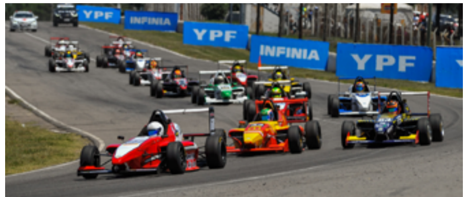
Deportes y Juventud de Río Grande.

Es preciso destacar que la participación de Blanchard en el campeonato 2018 fue posible gracias al apoyo de Proyectos Fueguinos y a la Agencia de