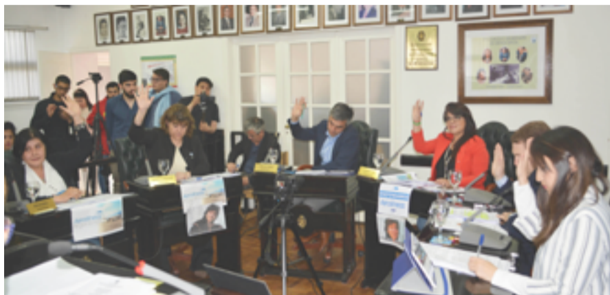
Desfinanciar a la ciudad

Y aseguró que la propuesta "no es política es lo que a uno le transmiten en la calle y nos preguntan cómo vamos a hacer para pagar porque nos han ajustado en todos lados e insistió que el Municipio va a poder recaudar más".