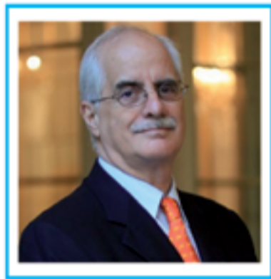
Jorge Taiana Ex Canciller y Ex Embajador de la República Argentina.